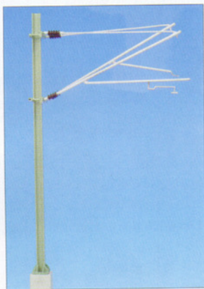
H0: Hobbyecke Schuhmacher zeigte einen neuen DB-Mast, Bettungsgleise, Gebüsch und Wagen.