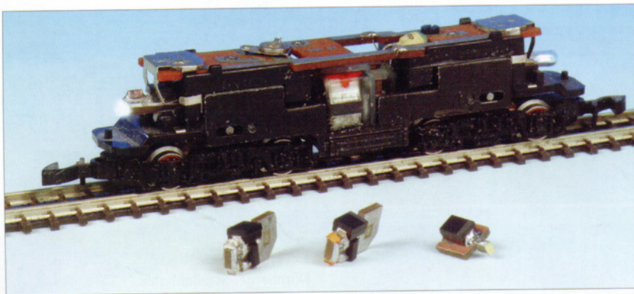
Z: Konstant leuchtende Spitzen- und Schlusslichter bietet HighTech für Z-Fahrzeuge an.