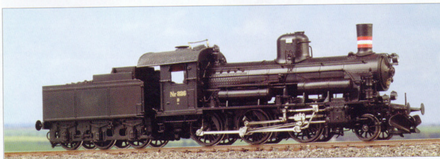
H0: Die dänische Dampflokomotive vom Typ D und die DSB-Di4 kündigt Hobby Trade an.

H0: Die im Vorjahr angekündigte Henschel-Diesellokomotive Di4 ist lieferbar. Künftig sind weitere Dekorationsvarianten zu erwarten. Die Di6 wird als „Dispolok“ erscheinen, wie sie in Deutschland anzutreffen ist. Neu angekündigt ist die dänische Dampflokomotive vom Typ B.